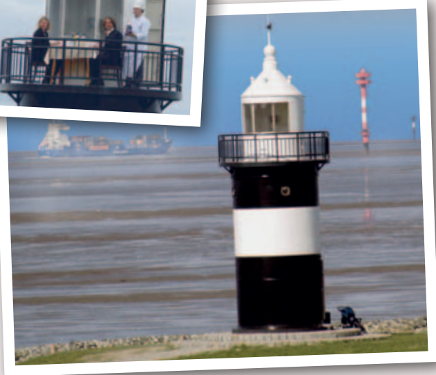
Leuchtturm Kleiner Preuße

Turm über dem Dorumer Tief. Die Aussichtsplattform des Leuchtturmes ermöglicht Ihnen einen weiten Blick über den Nationalpark „Niedersächsisches Wattenmeer“, der 2009 von der UNESCO als Weltnaturerbe aner-